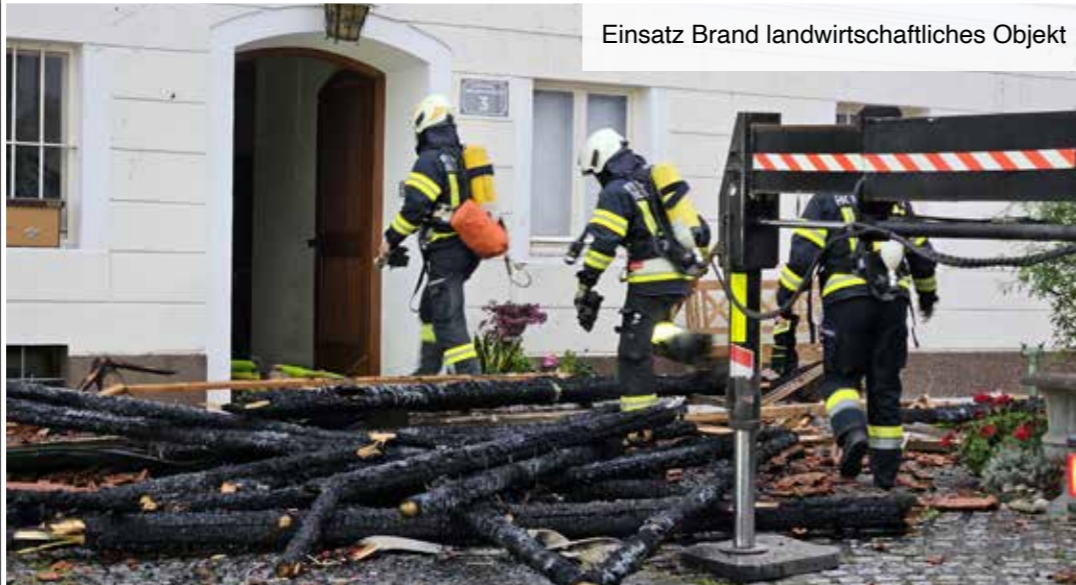
Einsatz Brand landwirtschaftliches Objekt