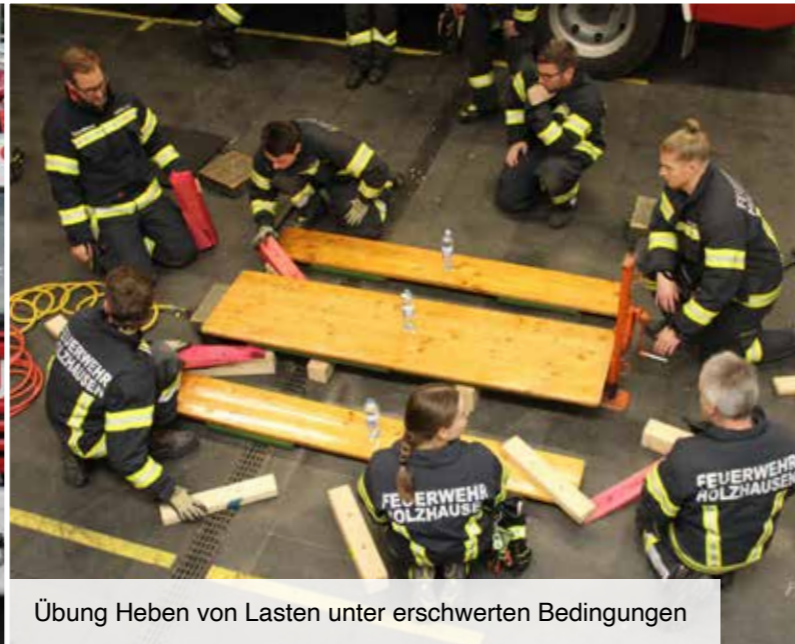
Übung Heben von Lasten unter erschwerten Bedingungen