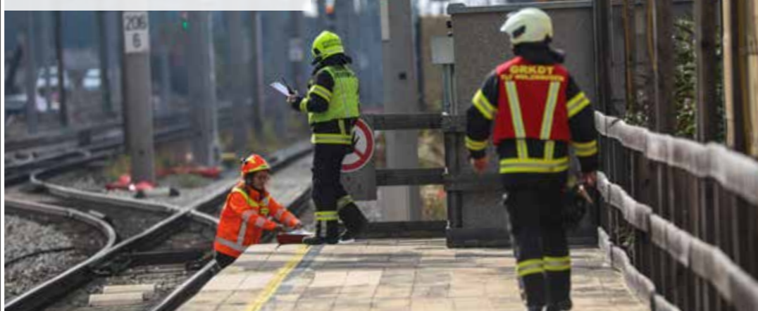
Einsatz Evakuierung Personenzug