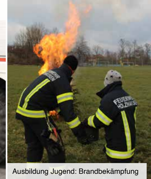
Ausbildung Jugend: Brandbekämpfung