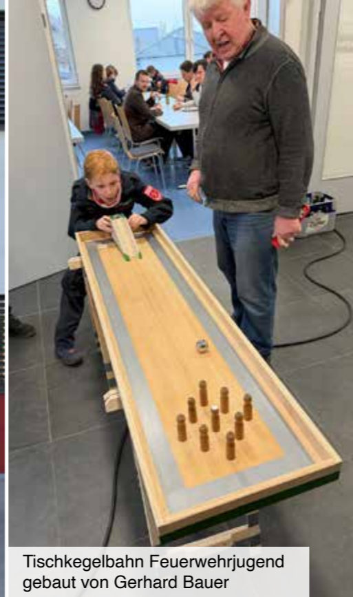
Tischkegelbahn Feuerwehrjugend gebaut von Gerhard Bauer