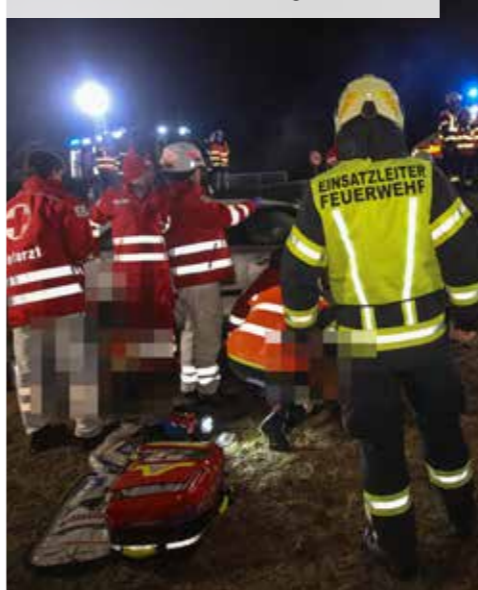
Einsatz Personenrettung aus PKW