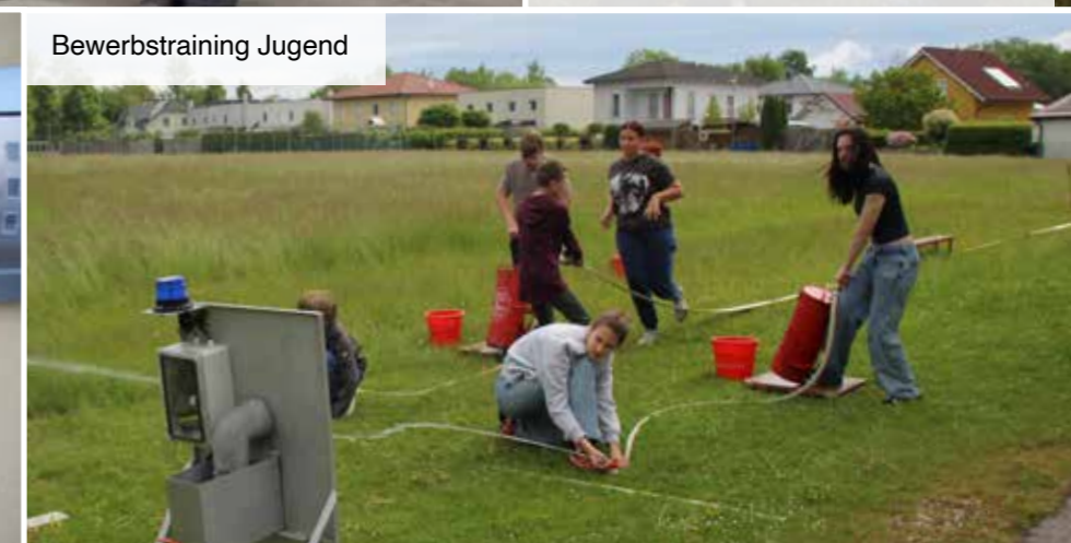
Bewerbst raining Jugend