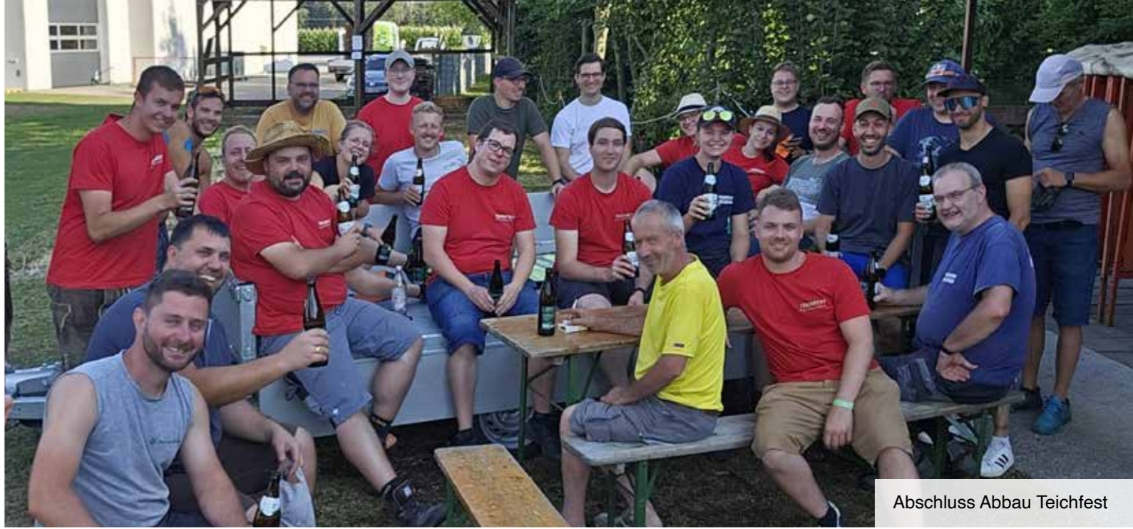
Abschluss Abbau Teichfest