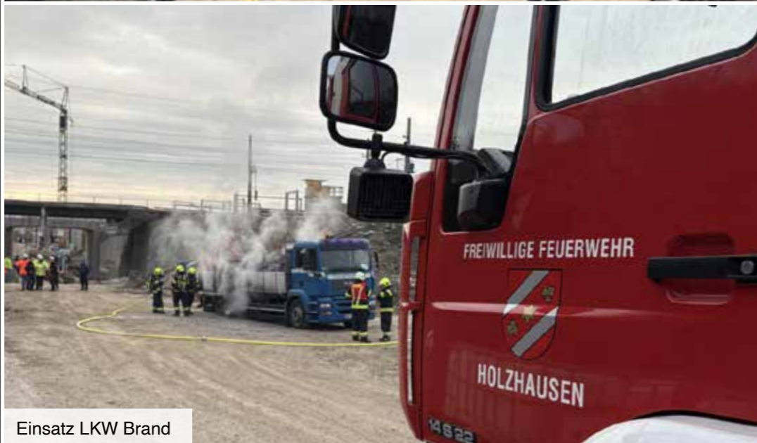
Einsatz LKW Brand