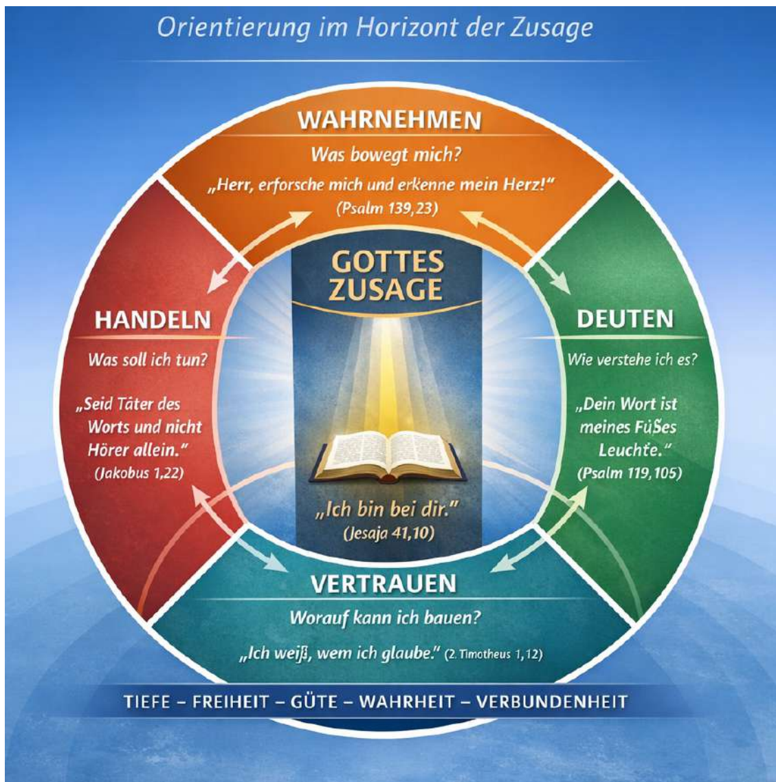
Erklärtabelle: Glaubensnavigator Systematische Entfaltung des Modells