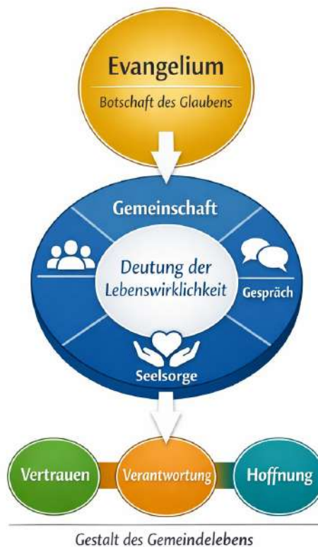
Abbildung: Kirche als Raum gemeinsamer Wirklichkeitsdeutung

Evangelium → Gespräch → Gemeinschaft → Verantwortung → Hoffnung