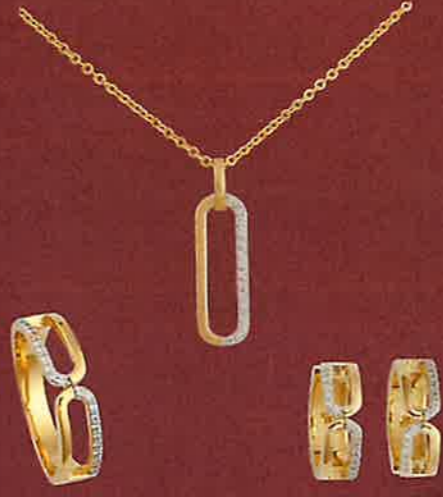
SET ES1367 Hänger € 109,00 Creolen € 149,00 Ring € 129,00 Kette € 16,00