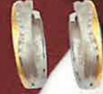
05.2124 Creolen Euro 115,00