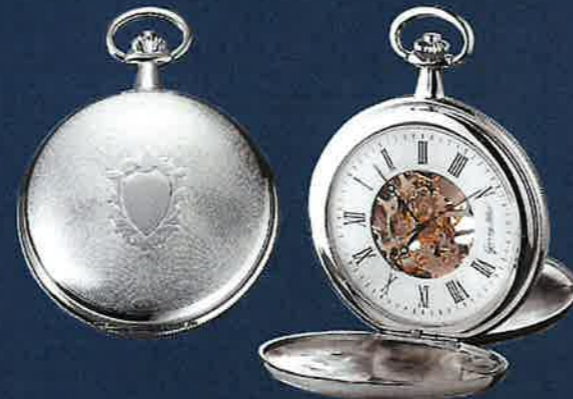
PW 402 TU verchromt Skelett Handaufzug, 51 mm Euro 184,00