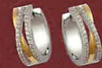
05.2120 Creolen Euro 169,00