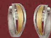
05.2122 Creolen Euro 109,00