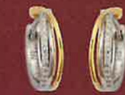
05.2121 Creolen Euro 99,00