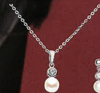
ANF01 40 42R Kette Euro 16,00

Alle Schmuckstücke sind vergrößert abgebildet. Vorbehaltlich Größen-, Satz- und Druckfehler. Preise können Edelmetallkursschwankungen unterliegen. Preise inkl. gesetzlicher MwSt. Preisirrtum vorbehalten. Alle Preise sind unverbindliche Preisempfehlungen des Herstellers.