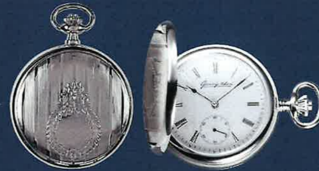
PW 401 U TU verchromt PTS9310 Handaufzug, 50 mm Euro 304,00