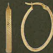
05.EG573 Creolen Euro 405,00