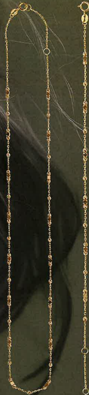
15.EG282 Collier Euro 635,00