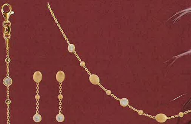
01 ES1374 Stecker Euro 49,00