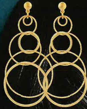
01.E51376 Stecker Euro 139,00