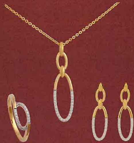
SET ES1366 Hänger € 109,00 Stecker € 169,00 Ring € 109,00 Kette € 16,00