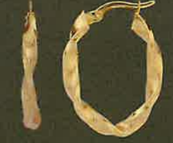
05.EG577 Creolen Euro 336,00