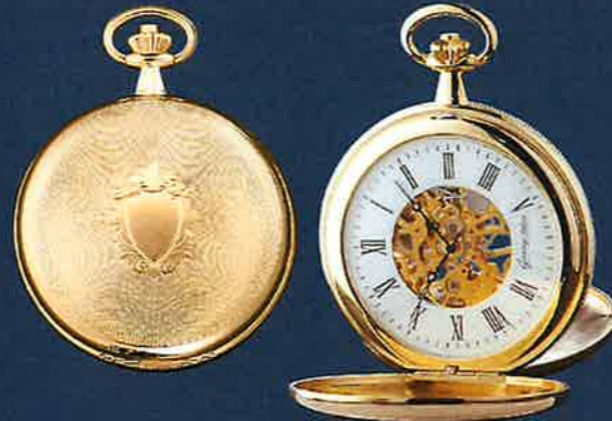
PW 402V TU vergoldet Skelett Handaufzug, 51 mm Euro 209,00