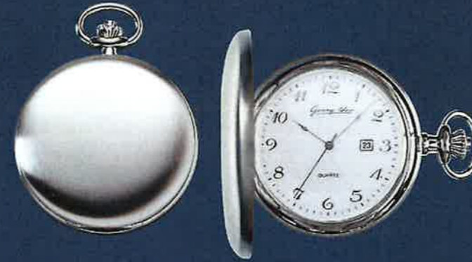
PW 406 Q TU verchromt Quarz 51 mm Euro 214,00