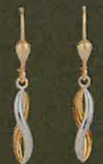
02.EG130 Bouton Euro 315,00