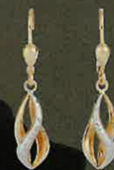
02.EG129 Bouton Euro 385,00