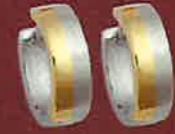
05.2123 Creolen Euro 109,00