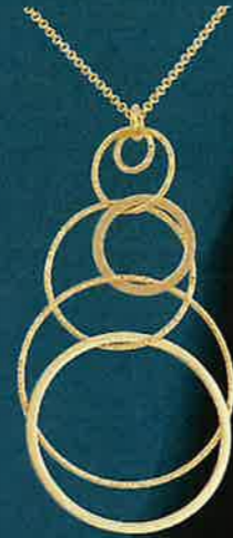
15.E51376 Collier Euro 109,00