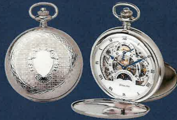
PW 407 TU verchromt Skelett Handaufzug, 53 mm Euro 538,00