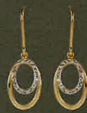
02.EG131 Bouton Euro 445,00