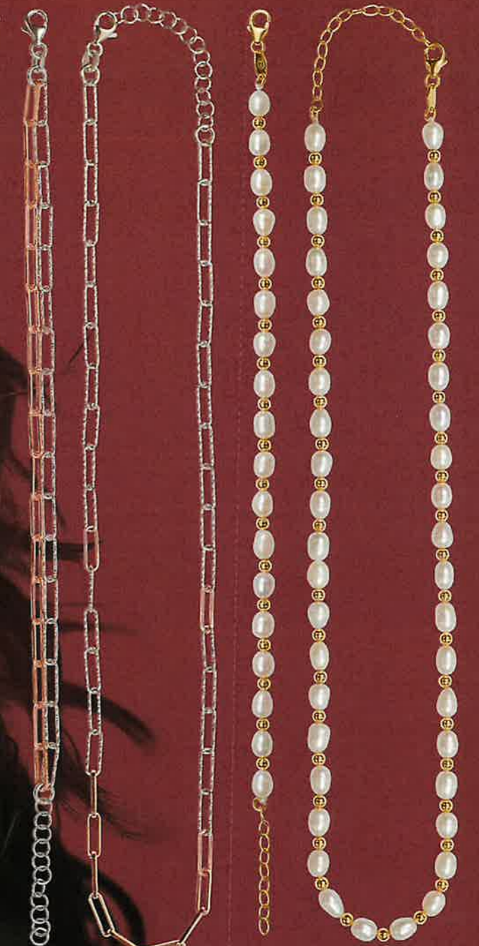
15 ES1371 Collier Euro 115,00