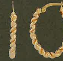
05.EG575 Creolen Euro 422,00