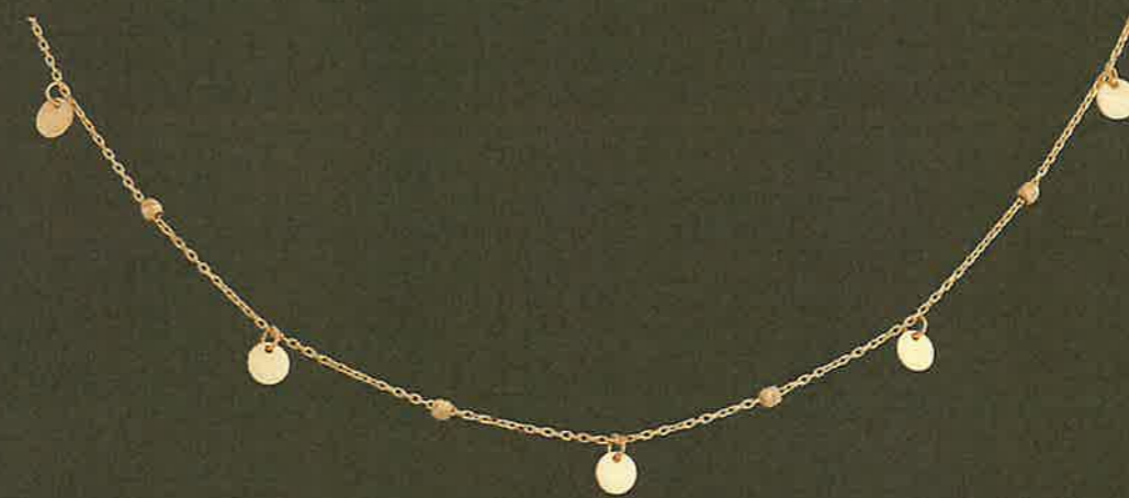
15.EG236 Collier Euro 335,00