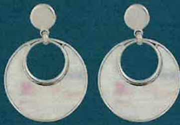
01.E51368 Stecker Euro 225,00