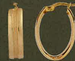
05.EG574 Creolen Euro 531,00