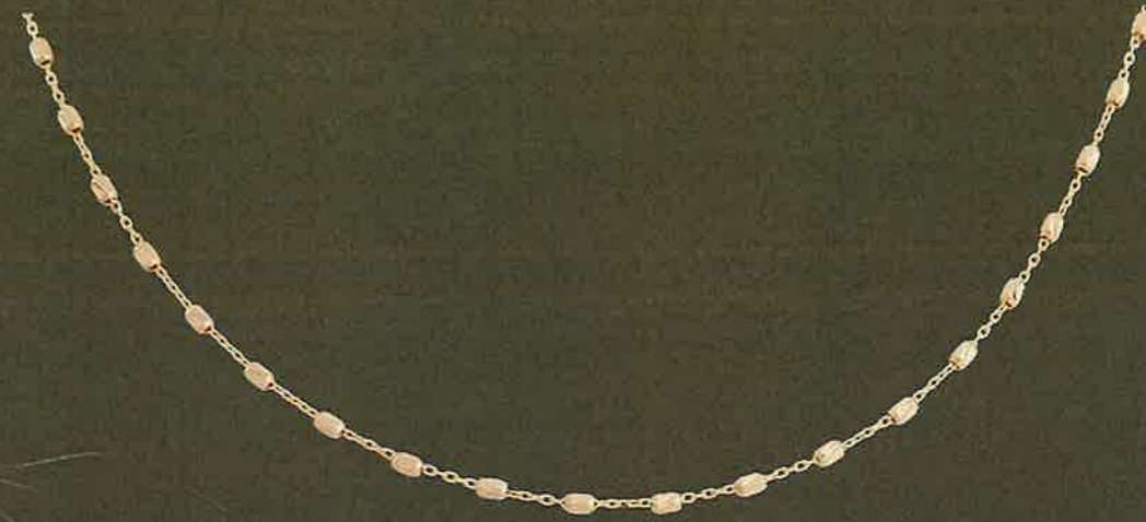
15.EG283 Collier Euro 639,00