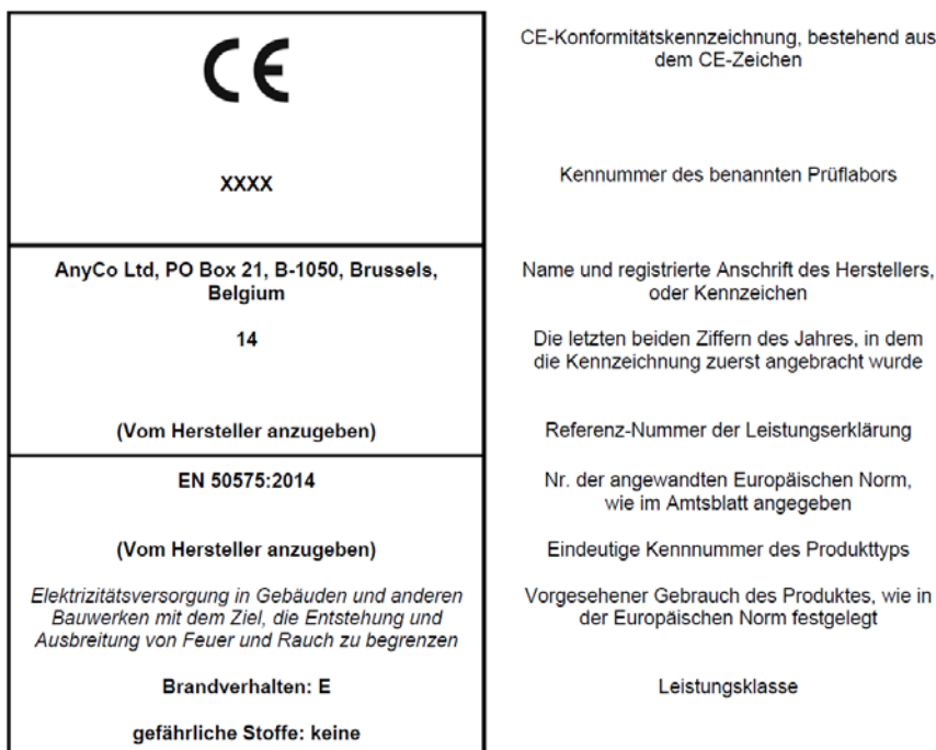
Bild 2 – Beispiel für die Angabe der CE-Kennzeichnung auf dem Produktetikett bei Produkten unter dem AVCP-System 3

Bei Produkten unter System 3 sind folgende Kennzeichnungen vorgesehen: