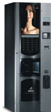
BVM 972 con pulsantiera alfanumerica.