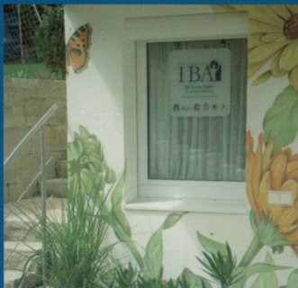
Der Sitz des europäischen IBA-Büros in Wiggensbach bei Kempten / Allgäu, Deutschland.

Wichtig ist dabei, dass die Systeme der Klienten insgesamt ausbalanciert werden. BodyTalk ist keine Diagnosemethode und wird nicht zur Behandlung spezifischer Krankheiten angewandt.