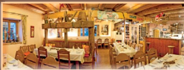
Gaststube 55 Personen