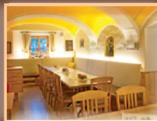
Stüberl 24 Personen