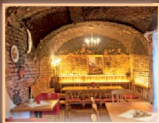
Backofen 15 Personen