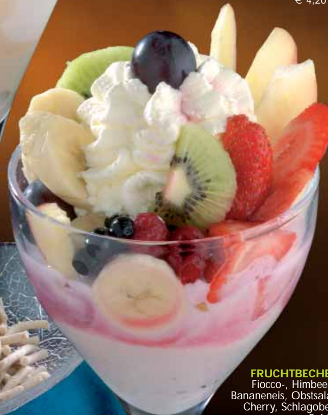
FRUCHTBECHER Fiocco-, Himbeer-, Bananeneis, Obstsalat, Cherry, Schlagobers € 4,50