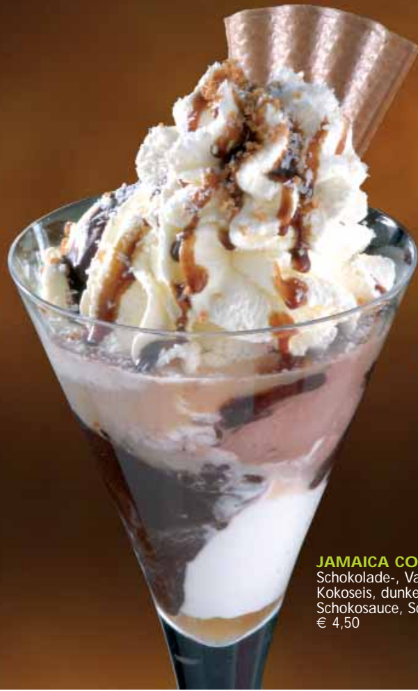
JAMAICA COUP Schokolade-, Vanille-, Kokoseis, dunkels Rum, Schokosauce, Schlagobers € 4,50