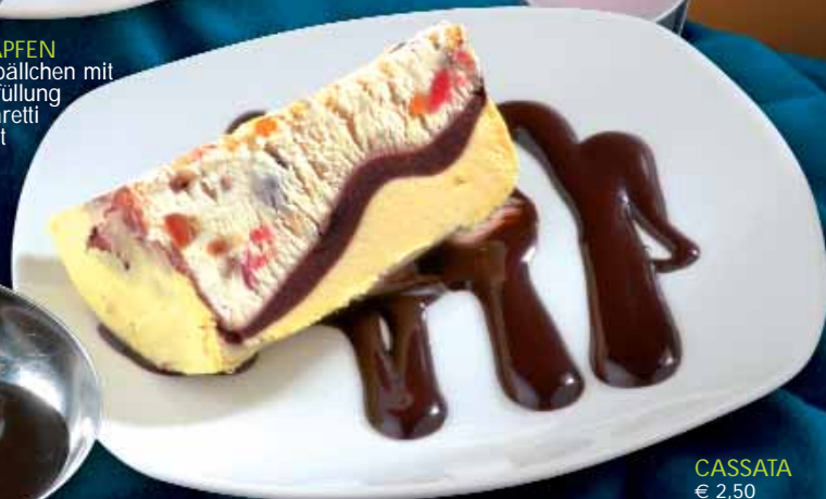
CASSATA € 2,50