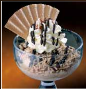
CASTAGNELLA Fiocco-, Haselnuss-, Schokoladeeis, Maronenpüree, Eierlikör, Schokosauce, Schlagobers € 5,50