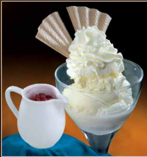
HEISSE LIEBE Fiocco-, Vanilleeis, heisse Himbeeren, Schlagobers € 4,20