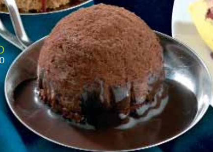
TARTUFO € 2,50