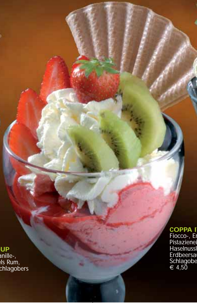
COPPA ITALIA Fiocco-, Erdbeer-, Pistazieneis, Haselnusslikör, Erdbeersauce, Schlagobers, Nüsse € 4,50