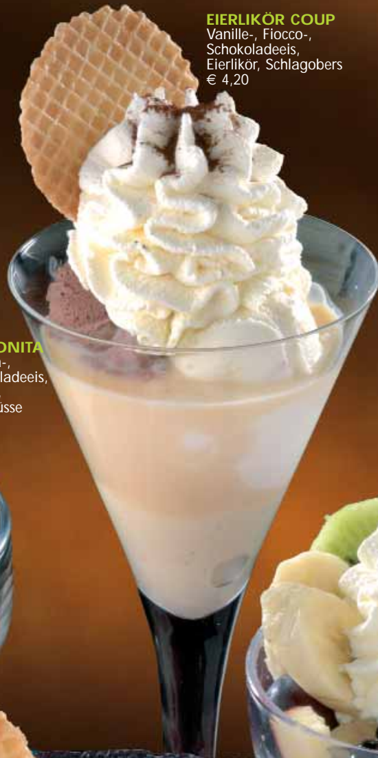
EIERLIKÖR COUP Vanille-, Fiocco-, Schokoladeeis, Eierlikör, Schlagobers € 4,20