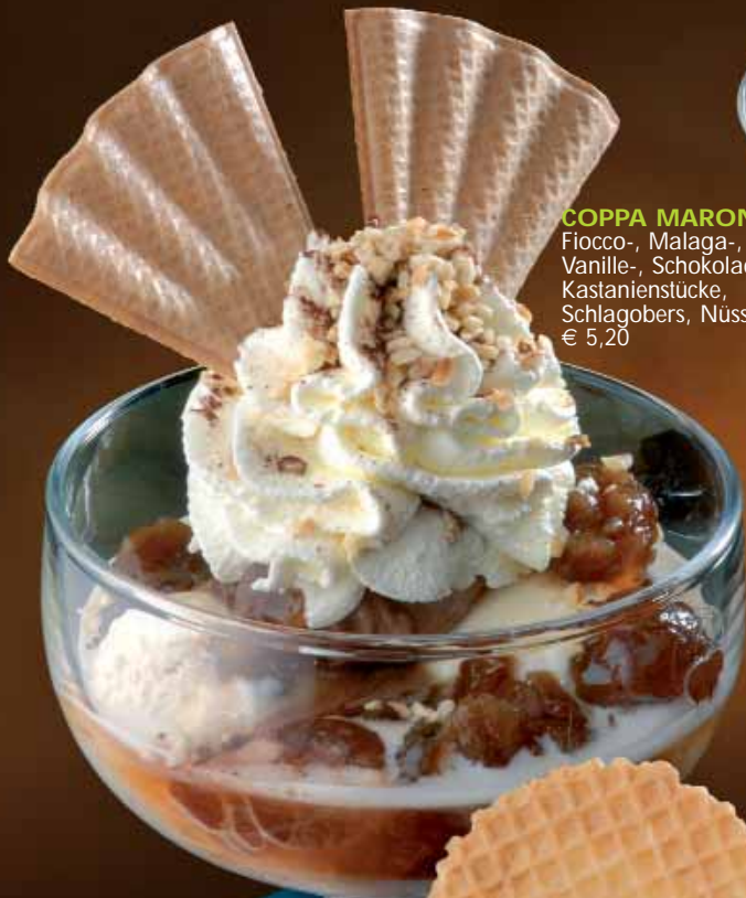
COPPA MARONITA Fiocco-, Malaga-, Vanille-, Schokoladeeis, Kastanienstücke, Schlagobers, Nüsse € 5,20