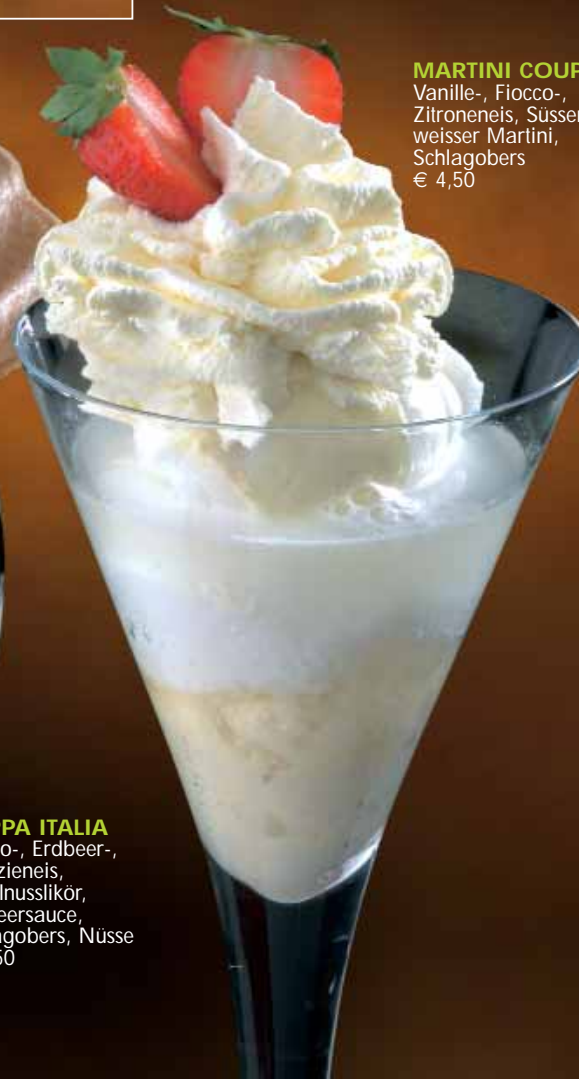
MARTINI COUP Vanille-, Fiocco-, Zitroneneis, Süsser weisser Martini, Schlagobers € 4,50