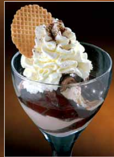
SCHOKO COUP Schokolade-, Haselnuss-, Fioccoeis, Schokosauce, Schlagobers € 4,20