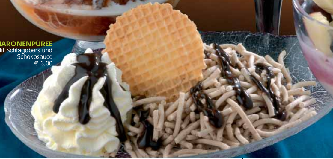
MARONENPÜREE Mit Schlagobers und Schokosauce € 3,00