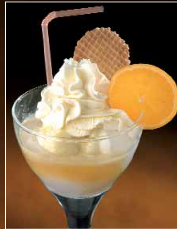
ORANGEN COUP Fiocco-, Zitronen-, Vanilleeis, Orangensaft, Schlagobers € 4,20